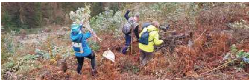
Ingurumen-boluntariotzako kanpainetan parte hartu zuten pertsonak.

“Ekimen hau lur-zaintzailtzako erakunde baten eta bi erakunde publikoren (Bakioko Udala, lursailaren titular eta esku-hartzearen sustatzaile gisa, eta Eusko Jaurlaritza, alderdi ekonomikoaren bideratzaile gisa) arteko lankidetzaren adibide ona da, natura-ingurunea guztion onura baita.”