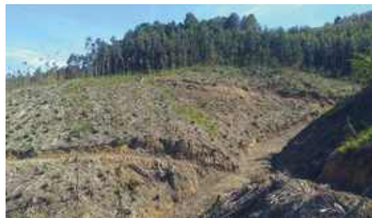
Esku hartu beharreko lurzatiaren egoera, jarduketa egin aurretik.