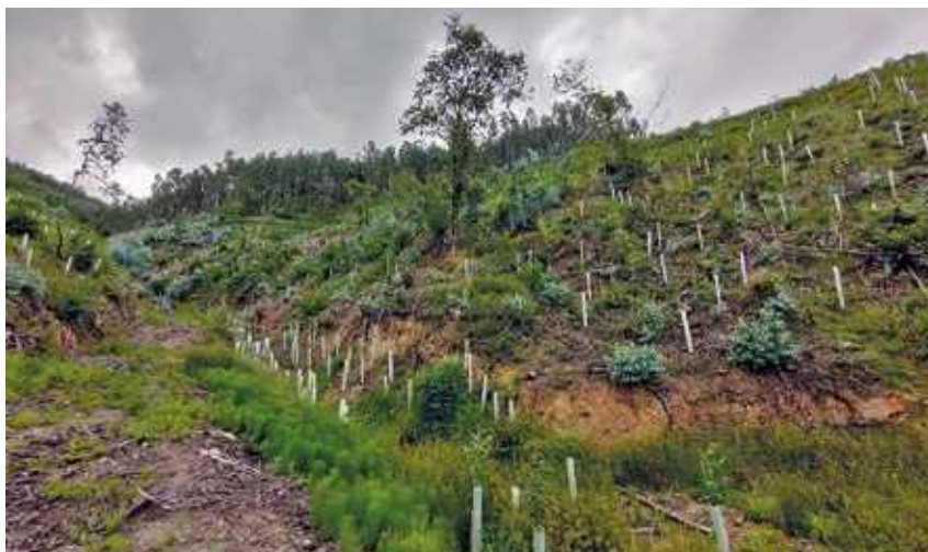
Jarduketa-eremuan egindako basoberritzea.

Basoberritzea osatzeko, zurkaitzak eta babesgarriak jarri ziren, eta irisgarritasunari eustea beharrezkoa ez den eremuetako baso-pista batzuk kendu ziren.