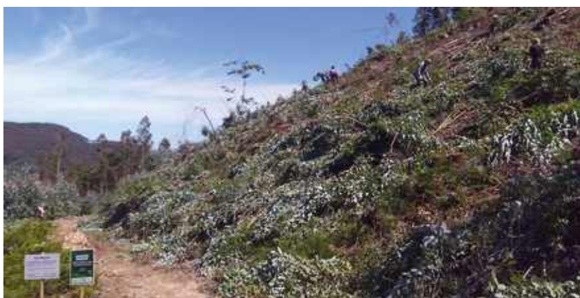
Eukaliptoen kimuak kontrolatzeko lanak jarduketa-eremuan.