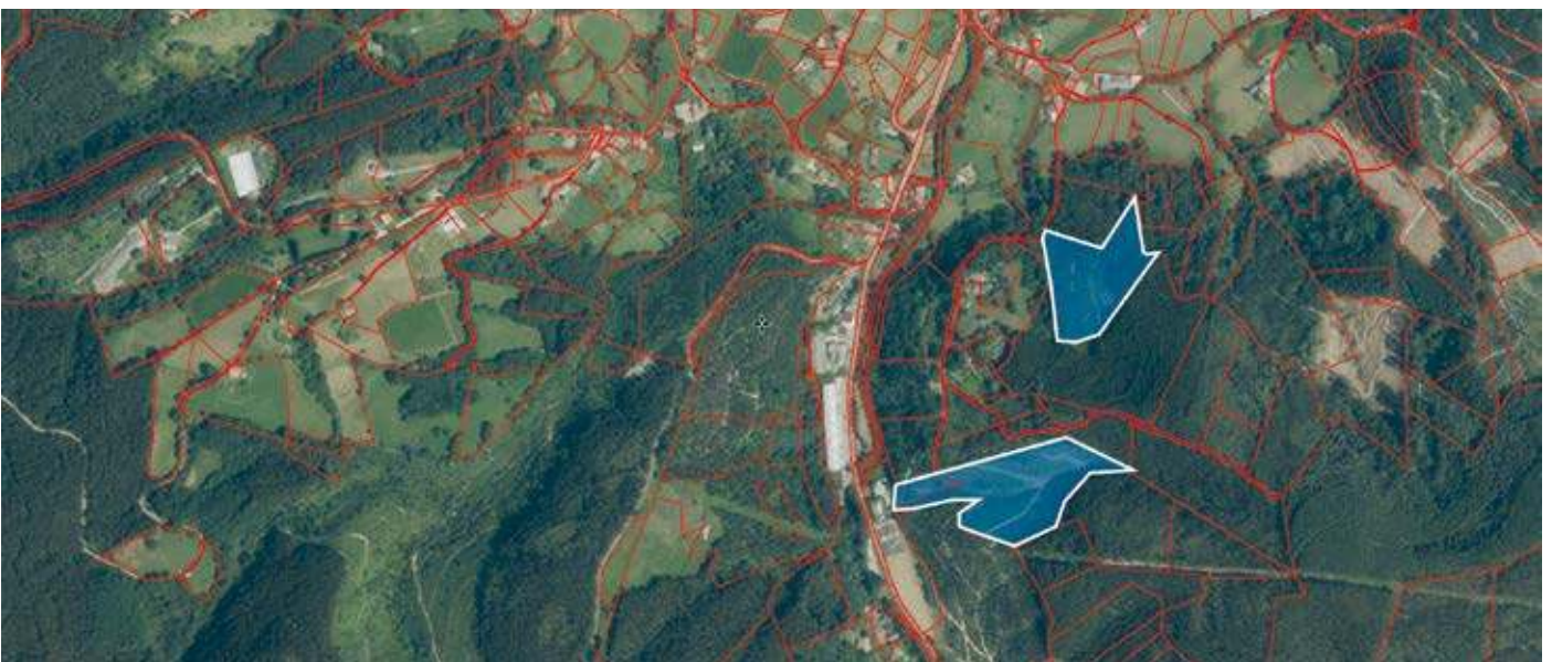
Localización de las parcelas objeto de intervención.

La reforestación se realizó sobre 5,7 ha divididas en dos parcelas dedicadas al aprovechamiento forestal con eucalipto ( Eucalyptus globulus ) previamente cosechadas.