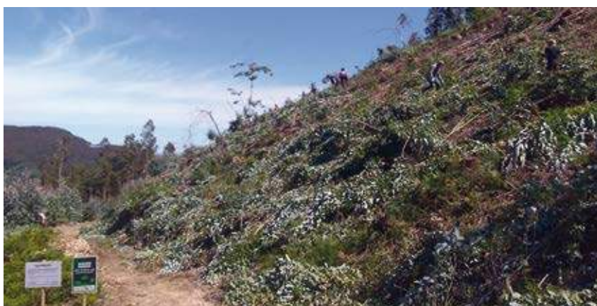
Trabajos de control de rebrote de los eucaliptos en la zona de actuación.