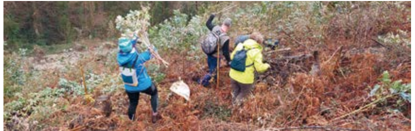
Personas participantes en las campañas de voluntariado ambiental.

“Esta iniciativa es un buen ejemplo de colaboración entre una entidad de Custodia del Territorio, y dos entidades públicas (Ayuntamiento de Bakio, como titular del terreno e impulsor de la intervención, y el Gobierno Vasco, como facilitador económico) por el bien común que constituye el entorno natural”