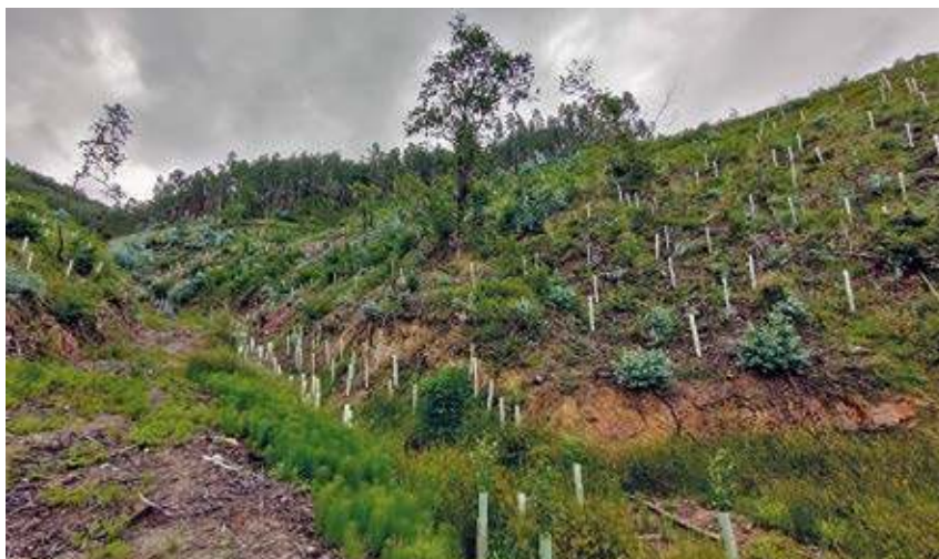
Repoblación llevada a cabo en el ámbito de actuación.

En total, se emplean 3.563 ejemplares , entre árboles y arbustos, lo que equivale a una densidad de plantación aproximada de 625 ejemplares por hectárea . La repoblación se completa con la colocación de tutores y protectores, y el desmantelamiento de algunas pistas forestales de saca de zonas en las que no se requiere mantener la accesibilidad.