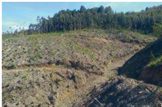
Estado de las parcelas objeto de intervención con carácter previo a la actuación.