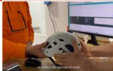
EWRS 2023 - Public administration - Reuse centre and drive for recovery "Reutilizagune"