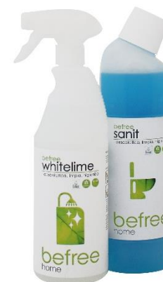
befree whitelime befree sanit