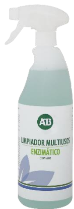
DD 456 Limpiador multiusos enzimático