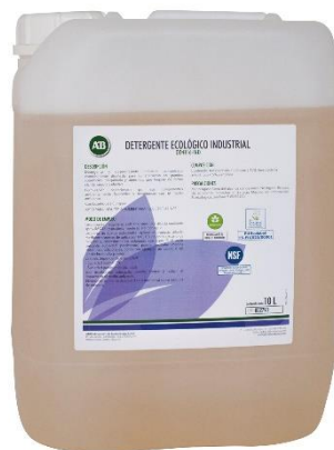
DD 4116 Detergente ecológico industrial