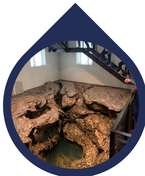
Itsasargiaren Etxea Hondalea